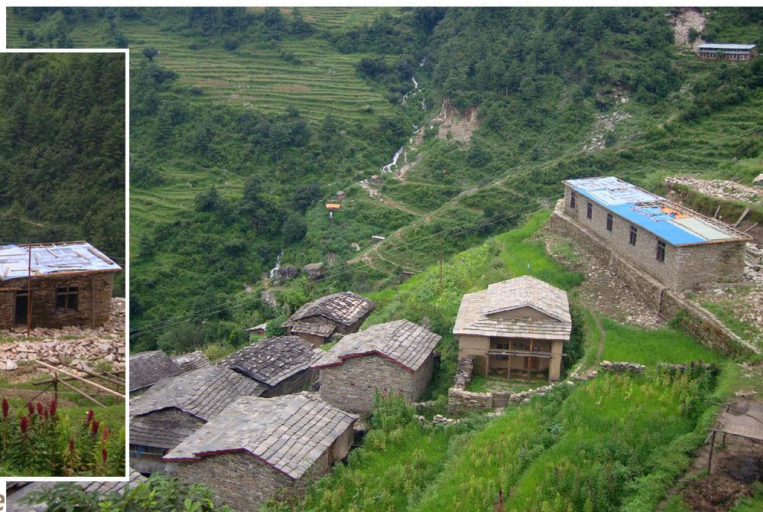
Photos d'Uhiya début septembre

Les travaux de construction du 1er bâtiment de l'école d'Uhiya sont presque terminés. Un programme de parrainage pourra démarrer dès que les équipements seront installés.