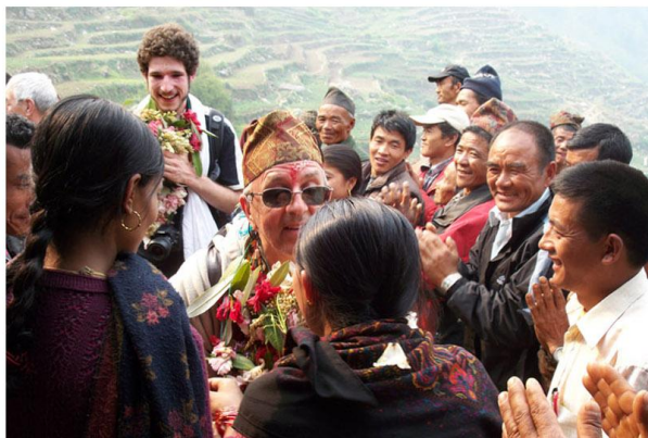
Accueil à Laprak