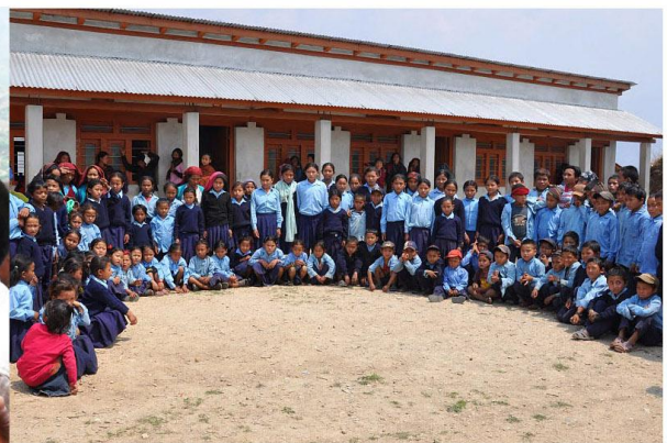
Les élèves devant leur école (Lapsibot)