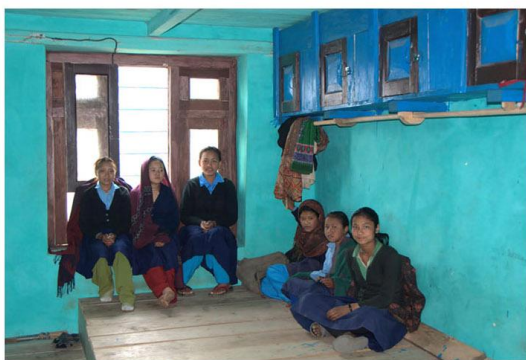
Dortoir des filles