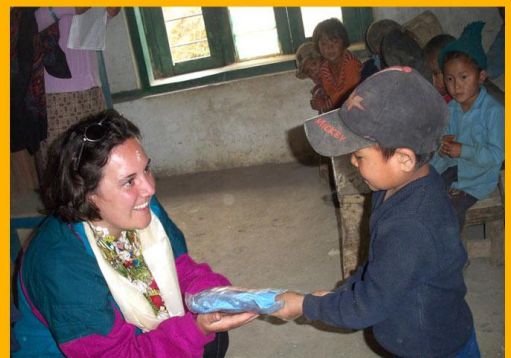
Remise des cadeaux à Gumda

Vous pouvez aider au financement, par exemple, en achetant de l'artisanat népalais lors de nos manifestations.